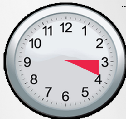
ساعت ملاقات ۳ تا ۴ بعد از ظهر

۷. از آوردن کودکان جهت ملاقات خودداری فرمایید.